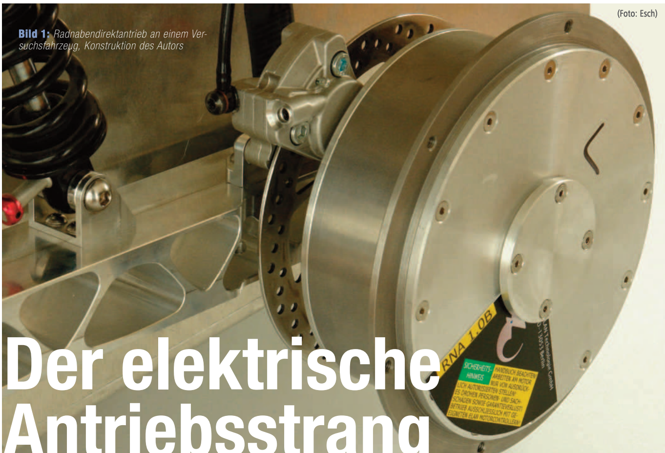
Bild 1: Radnabendirektantrieb an einem Versuchsfahrzeug, Konstruktion des Autors